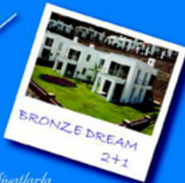
BRONZE DREAM 2+1