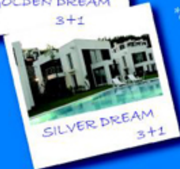
SILVER DREAM 3+1