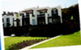
GOLDEN DREAM 3+1